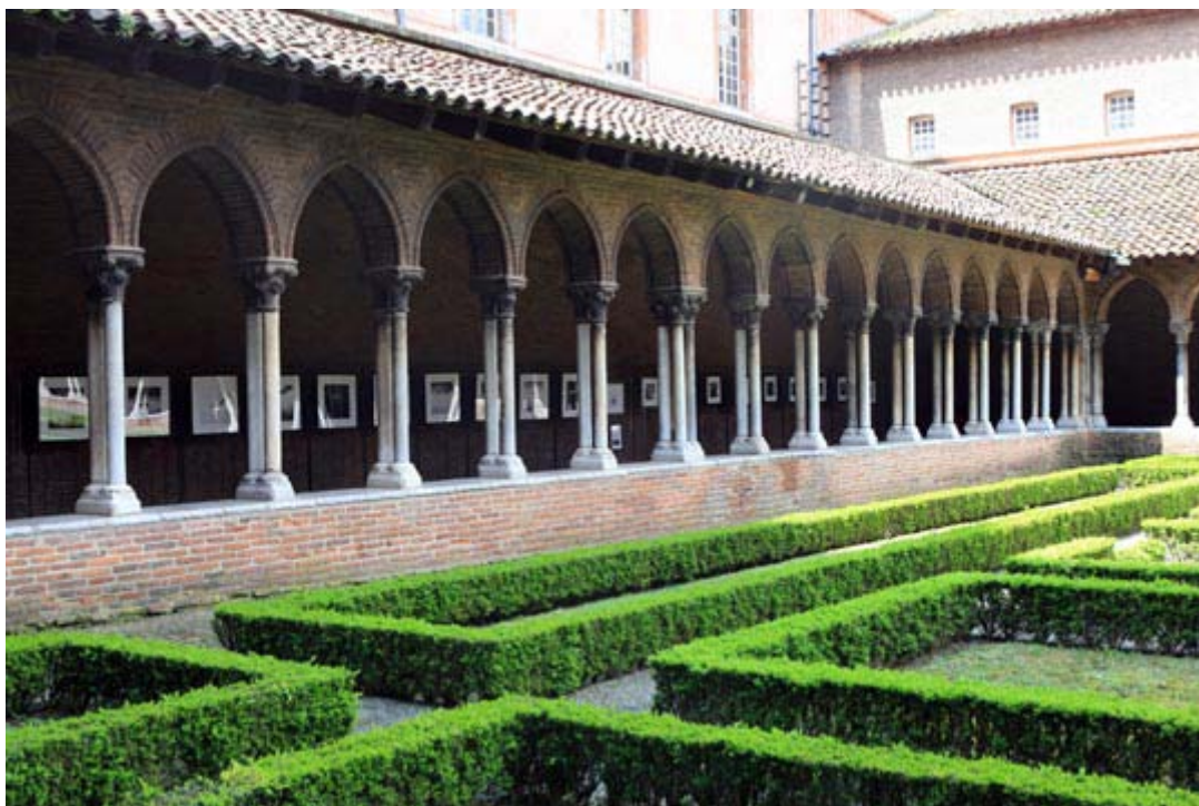
Exposition lors de la première édition