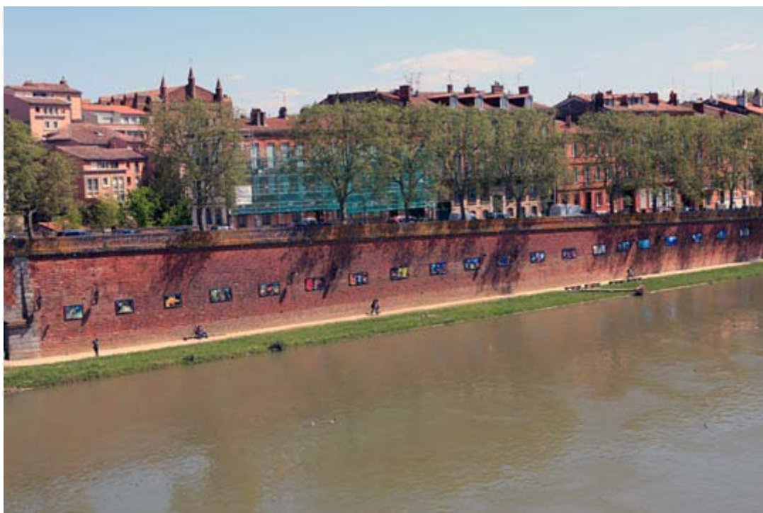
Exposition lors de la première édition