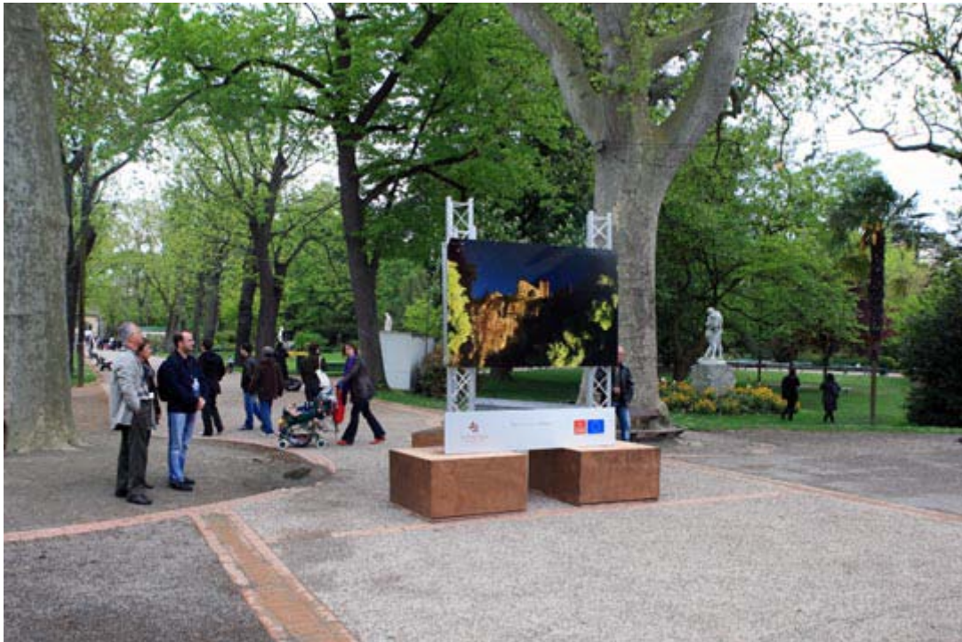
Exposition lors de la première édition

Il s'agit donc bien d'une réelle démocratisation de la photo, tant au niveau de l'équipement qu'au niveau de sa pratique et donc de sa finalité.