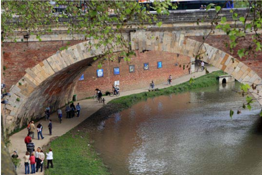
Exposition lors de la première édition